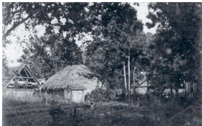
“Runči” Latvijas brīvvalsts laikā