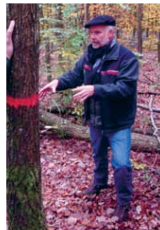
Vācijā kopšanu veic atstājot nākotnes kokus

Zemgales virsmežniecībai ir bijusi iespēja paaugstināt savu darbinieku kvalifikāciju. Viņi guva jaunu skatījumu uz jautājumiem, kas saistīti ar ilgtspējīgu mežsaimniecību (tirgus ekonomiku un brīvu konkurenci mežsaimniecībā, saimniekošanu ar nākotnes kokiem, augstu koksnes izmantošanas efektivitāti, izlases ciršu priekšrocību salīdzinājumā ar kailcirtēm, meža atjaunošanu – vērsot lielāku uzmanību uz dabīgo atjaunošanu un aizsardzību pret meža dzīvnieku postījumiem, iežogojumu), vides aizsardzību (bioloģisko daudzveidību, biosfēras rezervātu, lieliem starptautiskiem projektiem par dabas aizsardzības, piemēram, “ ForeSTClim ”) un medību saimniecības organizēšanu (meža dzīvnieku postījumu samazināšana, saglabājot augstu medību saimniecības intensitāti, praktiska medību norise un organizācija, radiācijas mērīšana mežacūkām), meža īpašnieku un skolēnu apmācību, izmantojot speciālus šim nolūkam paredzētus centrus Mārketinga un komunikācijas daļā ( Neupfalz ), Meža ekoloģijas un mežsaimniecības pētīšanas iestādē ( Trippstadt ), Biosfēras punktā ( Wasgau ) un