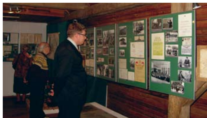
Izstādes Madonas novadpētniecības un mākslas muzejā būs skatāmas līdz 26. septembrim

niecības fakultāti) un 18 rbļ. valsts aizņēmumam. Otrajā izmaksā atkal 18 rbļ. aizgāja valsts aizņēmumam, bet 28,10 rbļ. – formas tērpa iegādei. Nepilnus desmit gadus agrāk, vācu okupācijas laikā, mežsarga amatā Madonas mežniecībā strādājis Aleksandrs Liepiņš. Pēc arhīva ziņām viņa mēneša pamatalga bijusi 100 reihsmarkas (RM). Pie tās vēl pierēķināta braukšanas nauda 15 RM. Šīs 115 RM tad arī bija ar algas nodokli apliekamā summa, taču vēl 15 RM Liepiņš saņēma kā ģimenes piemaksu par 3 nepilngadīgajiem bērniem. Atvilkumi bijuši sociālajai apdrošināšanai 4,03 RM, pensiju fondam 1,95 RM, arodsavienībai – 1,15 RM, par