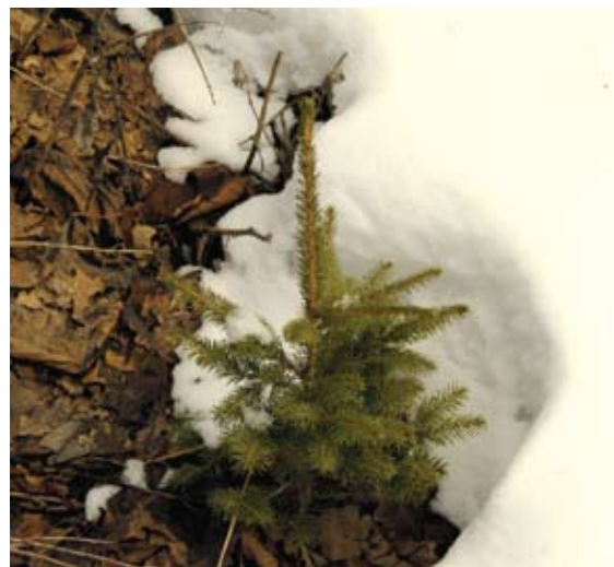
Saimnieks regulāri kopj iestādītās priedītes un eglītes un uzskata, ka tikai tā var izaudzēt kvalitatīvu mežu