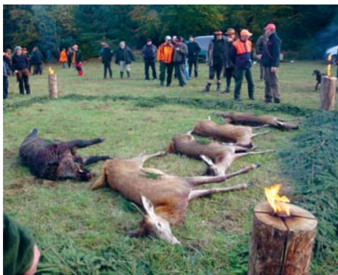
Medībās, kurās piedalījāties, nomedīts viens kuilis, briežu bullis, divas govīs un teļš, viena lapsa

Medības valsts mežos pārsvarā organizē mežniecības. Ļoti maz platību tiek nodots izsolē medniekiem (parasti uz 10 gadiem). Privātajiem medniekiem minimālā medību platība ir 75 ha. Mednieku pieteikšanās uz medībām ar dzinējiem notiek iepriekš, mežniecības mājas lapā, kamēr vien ir brīvas vietas. Ja pieteikums tiek apstiprināts,